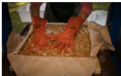
Must var det här!