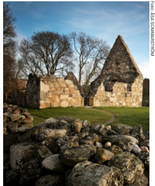
Ett av stoppen blir i Orkesta kyrka, en romansk landsorts- kyrka från 1200-talet och Össeby kyrkoruin.