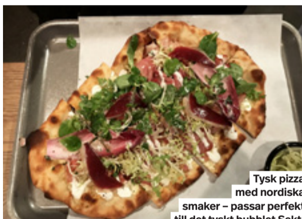
Tysk pizza med nordiska smaker – passar perfekt till det tyskt bubblat Sekt.

Särskilt maultachen, tyskarnas svar på ravioli, är ett alptoppshögt utrops-tecken. Det är en mustig smakbomb, perfekt för en kall höstdag.