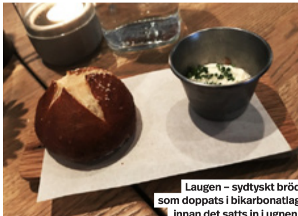
Laugen – sydtyskt bröd som doppats i bikarbonatlag innan det satts in i ugnen.