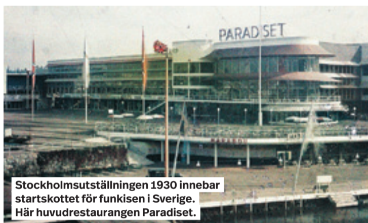
Stockholmsutställningen 1930 innebar startskottet för funkisen i Sverige. Här huvudrestaurangen Paradiset.