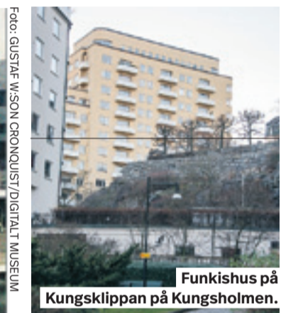
Funkishus på Kungsklippan på Kungsholmen.