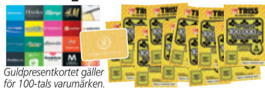
Guld-presentkortet gäller för 100-tals varumärken.

Rutorna med de röda siffrorna bildar en lösningskod som kan utläsas som ett fyrsiffrigt tal – t ex NIO ETT TJUGO (9120). Du kan ringa , swisha eller SMS:a in koden.