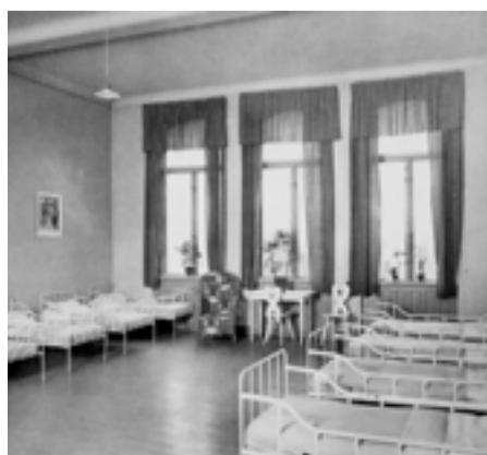
Barnen på Eugeniahemmet bodde i stora sovsalar.