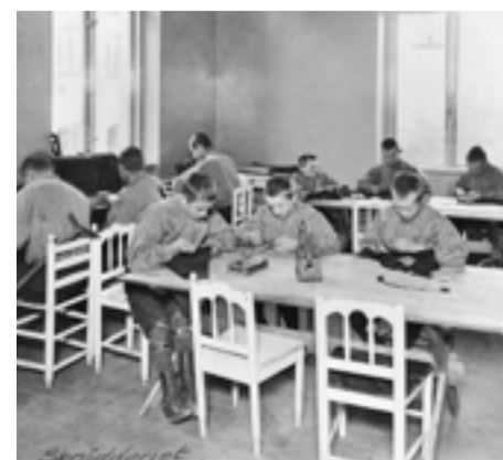
Barnen kunde få utbildning till skomakare eller sömmerskor.