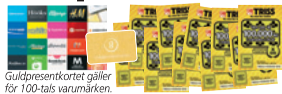
Guld-presentkortet gäller för 100-tals varumärken.

Rutorna med de röda siffrorna bildar en lösningskod som kan utläsas som ett fyrsiffrigt tal – t ex NIO ETT TJUGO (9120). Du kan ringa , swisha eller SMS:a in koden.