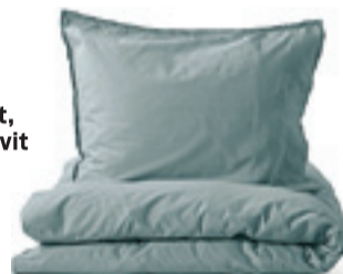
Rockport, bäddset, (finns även i rosa, vit och mörkblå), 299 :-