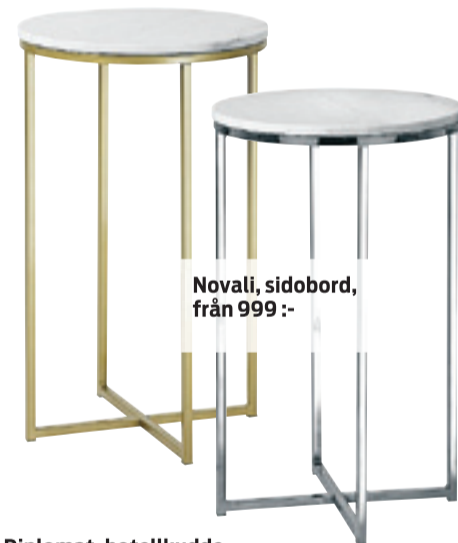
Novali, sidobord, från 999 :-