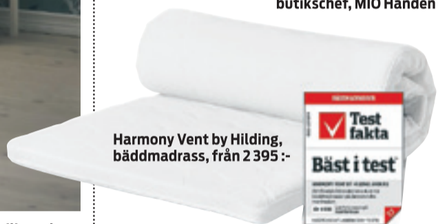
Harmony Vent by Hilding, bäddmadrass, från 2 395 :-