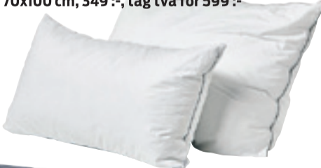
Diplomat, hotellkudde, 50x90 cm, 299 :-, tag två för 499 :- 70x100 cm, 349 :-, tag två för 599 :-