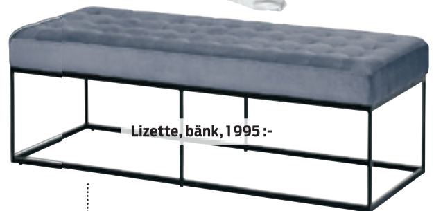
Lizette, bänk, 1995 :-