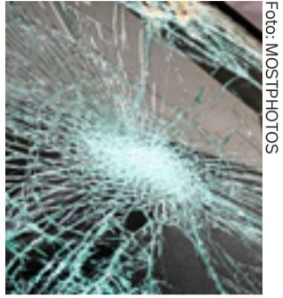
Stenen kastades från en av Husbys gångbroar.