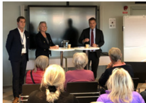
Runt 40 invånare kom till dialogmötet där representanter från majoritetspartierna mötte Lidingöbor.