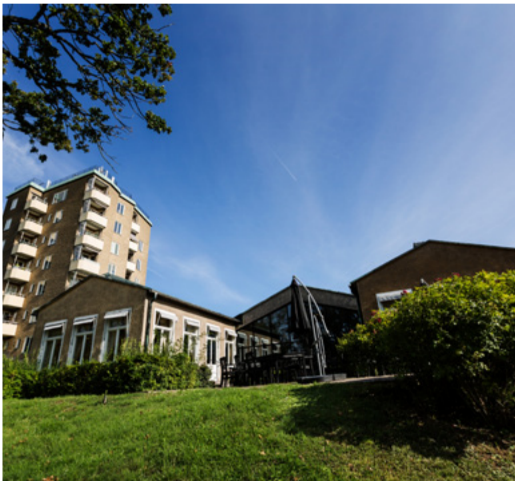
Attendos måltidsabonnemang för de boende på Björnbo har fått hård kritik.