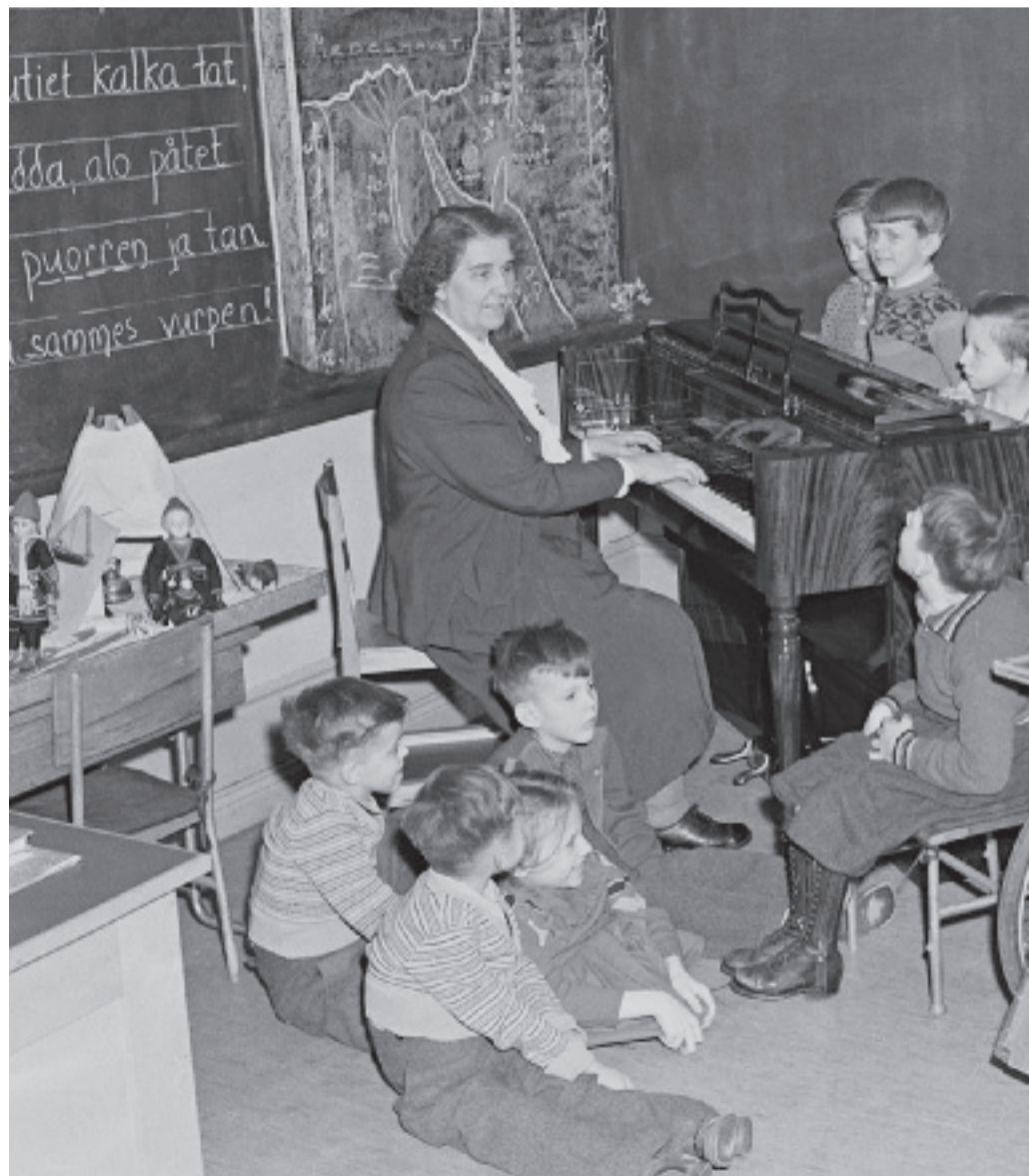
Så här såg det ut på 50-talet när fröken Lundström hade musiklektion i klassrummet.

INGRID JOHANSSON ingrid.johansson@mitti.se tel 08-550 551 04