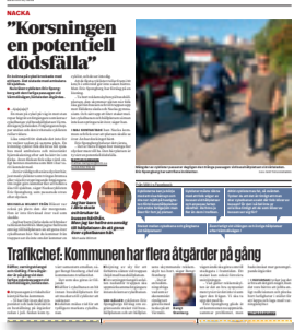
Mitt i den 10 september.

lats i asfalten nedanför trappan. Frågan är om det räcker för att tysta kritikerna.