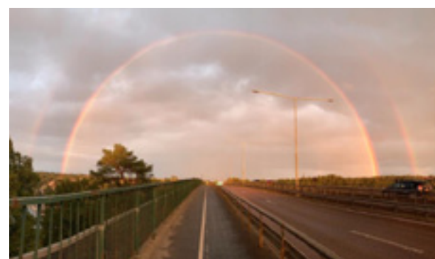
Efter viss möda fick Oskar Bård den perfekta bilden av den dubbla regnbågen över Skurubron.