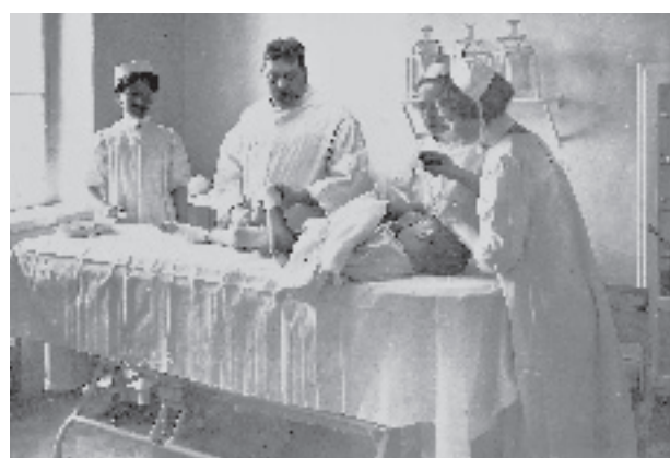
Året var 1914, och "vanföra" barn bodde, vårdades och gick i skola på Eugeniahemmet.