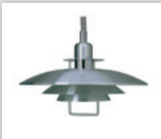
Primus taklampa diameter 43 cm från (1649.-) NU! 1319.-