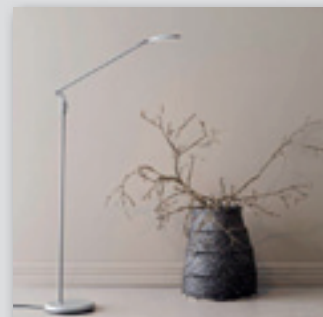
Spectra LED golvlampa från (3149.-) NU! 2519.-