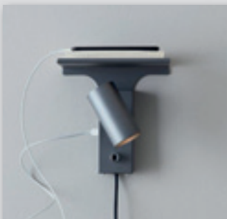
Tyson LED med USB och hyllplan från (2024.-) NU! 1619.-