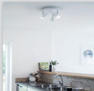
Dex spotlight från (1949.-) NU! 1559.-