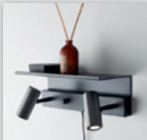
Cato dubbel LED med hyllplan från (2498.-) NU! 1998.-