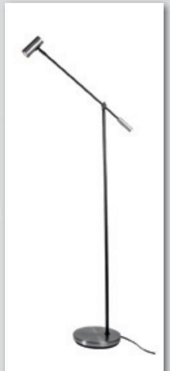
Cato LED golvlampa från (2749.-) NU! 2199.-

20% RABATT på allt från Belid ljushuset.se