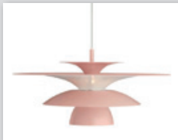
Picasso LED taklampa diameter 38cm från (2049.-) NU! 1639.-

20% RABATT på allt från Belid ljushuset.se