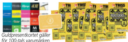
Guldpresentkortet gäller för 100-tals varumärken.

Rutorna med de röda siffrorna bildar en lösningskod som kan utläsas som ett fyrsiffrigt tal – t ex NIO ETT TJUGO (9120). Du kan ringa, swisha eller SMS:a in koden.