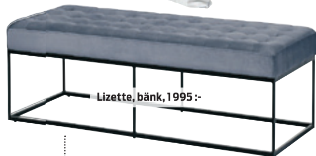
Lizette, bänk, 1995 :-