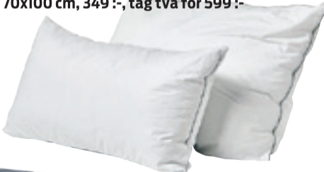
Diplomat, hotellkudde, 50x90 cm, 299 :-, tag två för 499 :- 70x100 cm, 349 :-, tag två för 599 :-