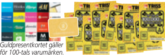
Guld-presentkortet gäller för 100-tals varumärken.

Rutorna med de röda siffrorna bildar en lösningskod som kan utläsas som ett fyrsiffrigt tal – t ex NIO ETT TJUGO (9120). Du kan ringa , swisha eller SMS:a in koden.