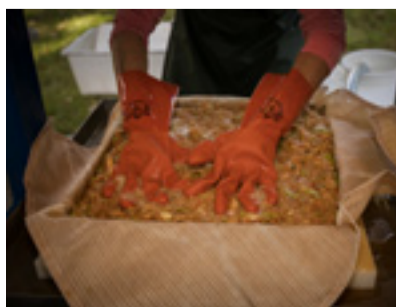
Must var det här!