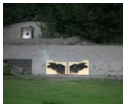
Både rörliga och stillastående tavlor med älgar är målet för kvällen.