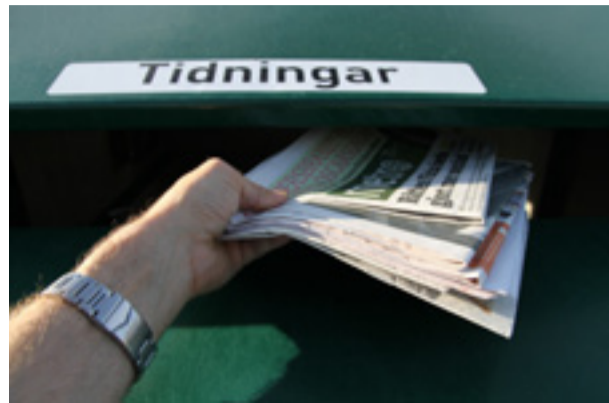
Den 8 oktober ställs en ny återvinningsstation ut på Bergväggsvägen.

STATIONERNA ger hushållen möjlighet att lämna sina pappers-, plast-, metall- och glasförpackningar samt tidningar till återvinning,