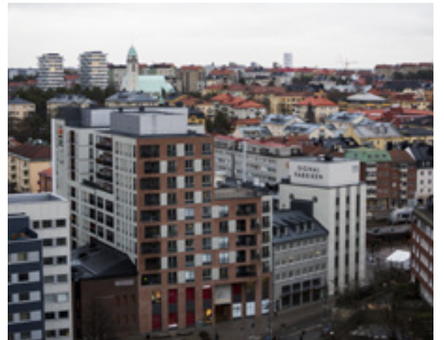
Sundbyberg behöver bli bättre på upphandling, information till företag, service och dialog.

– En majoritet av företagen i Sundbyberg är nöjda, men 17 procent uppger att de inte är det. Det finns potential för Sundbyberg att