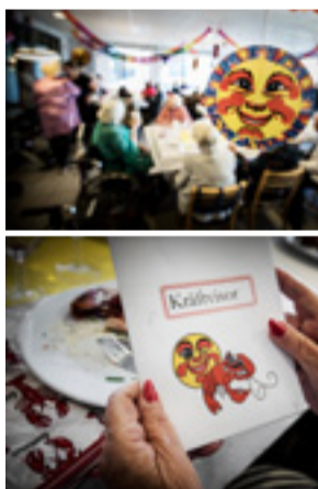
Lyktor och sång hör kräftskivor till.