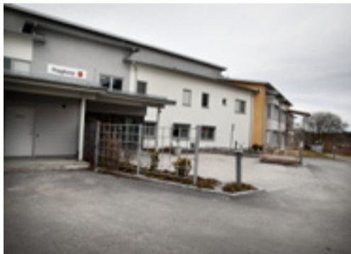
Hagtorps drivs sedan maj 2019 av Attendo.