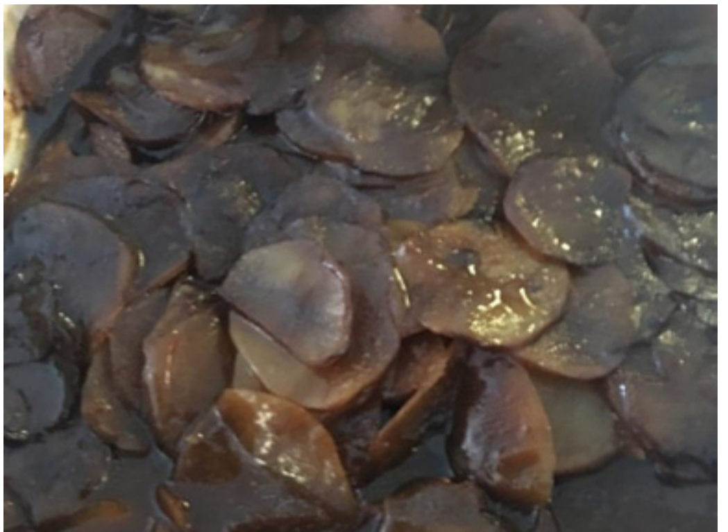
Så här såg sjömansbiff som serverades på Hagtorp ut. ”Allting var svart och med en konstig bismak. Många valde att inte äta. Ledde till magont och illamående”, berättade en anhörig.