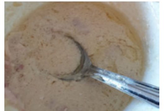
Fläskgryta med blomkål och potatis.