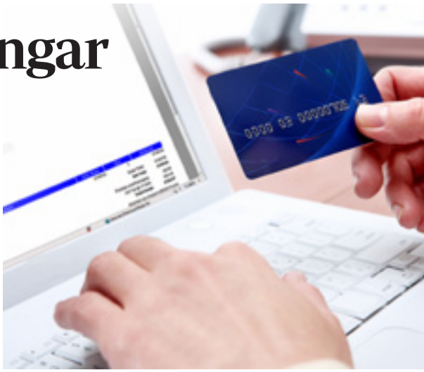
Kortbedrägerier, romans- och investeringsbedrägerier är det som ökar mest.