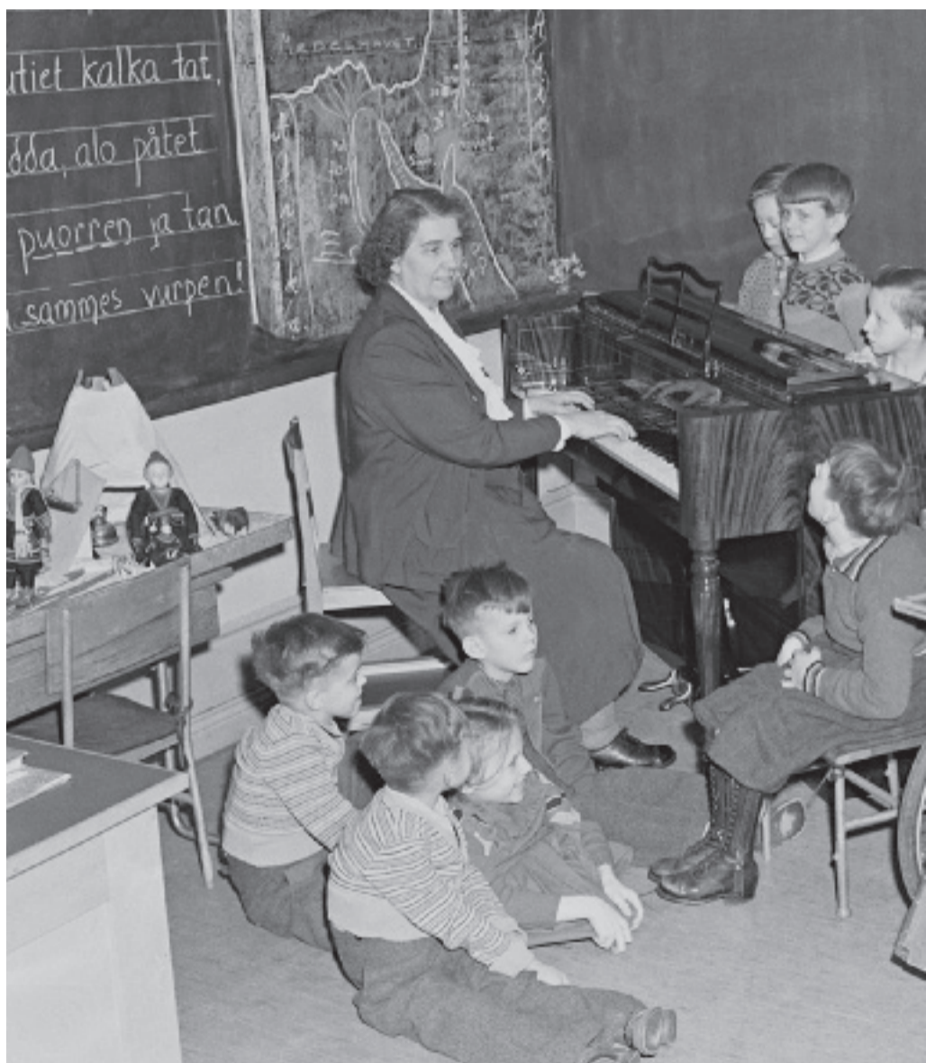
Så här såg det ut på 50-talet när fröken Lundström hade musiklektion i klassrummet.

INGRID JOHANSSON ingrid.johansson@mitti.se tel 08-550 551 04