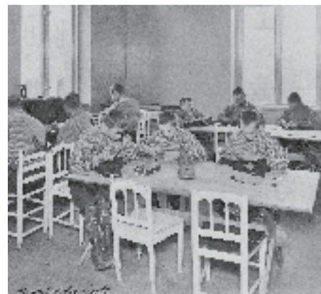
Barnen kunde få utbildning till skomakare eller sömmerskor.