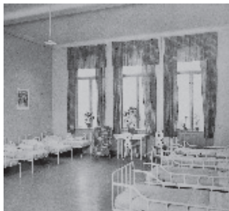
Barnen på Eugeniahemmet bodde i stora sovsalar.