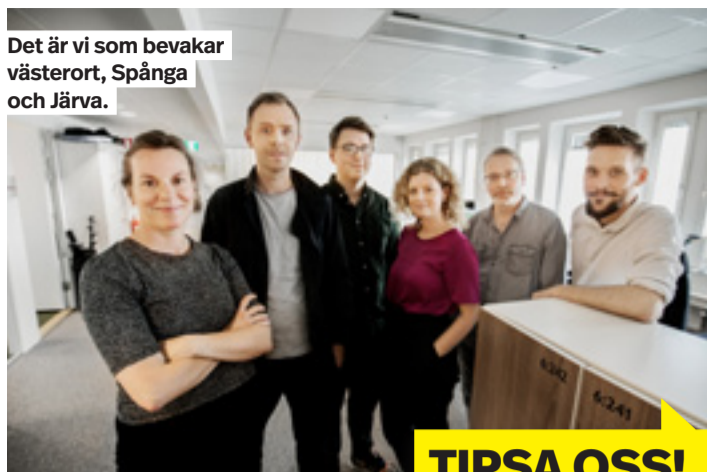
Det är vi som bevakar västerort, Spånga och Järva.

Facebook: Sök på "Mitt i Västerort" Twitter: @mittistockholm Instagram: @mittistockholm