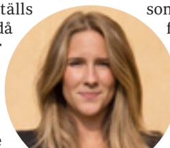
Ida Drougge (M) vill avskaffa Robin Hood-skatten.