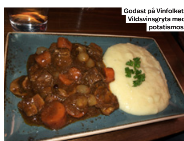
Godast på Vinfolket: Vildsvinsgryta med potatismos.