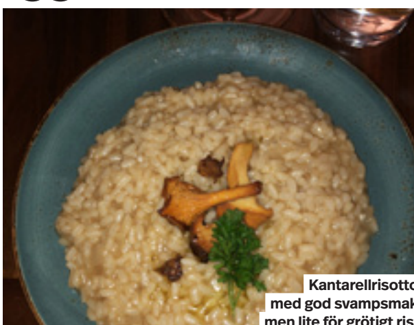
Kantarellrisotto med god svampsmak men lite för grötigt ris.