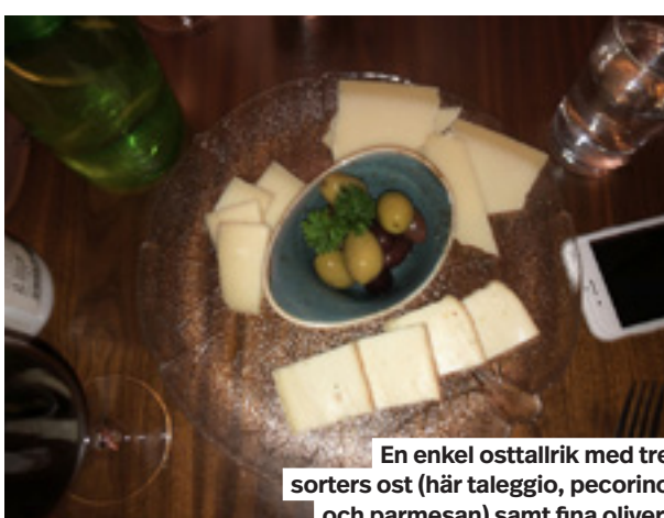
En enkel ostallrik med tre sorters ost (här taleggio, pecorino och parmesan) samt fina oliver.

Den som vill ha en bit mat till druvorna hittar halvportioner i en mycket kort meny. I ett huj har man ätit sig igenom allt, en del är riktigt bra, annat lämnar övrigt att önska.