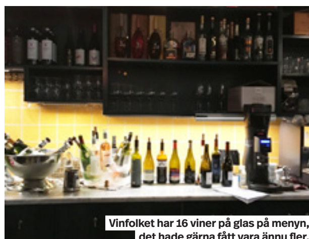
Vinfolket har 16 viner på glas på menyn, det hade gärna fått vara ännu fler.