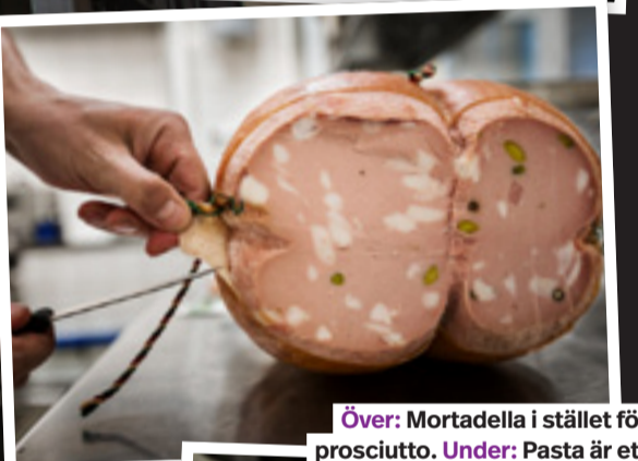
Över: Mortadella i stället för prosciutto. Under: Pasta är ett måste även om man satsar på en modern meny.