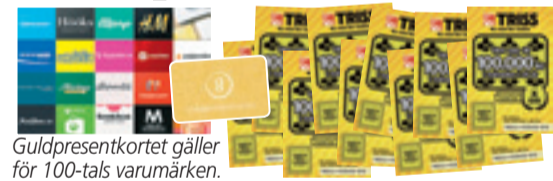
Guld-presentkortet gäller för 100-tals varumärken.

Rutorna med de röda siffrorna bildar en lösningskod som kan utläsas som ett fyrsiffrigt tal – t ex NIO ETT TJUGO (9120). Du kan ringa, swisha eller SMS:a in koden.