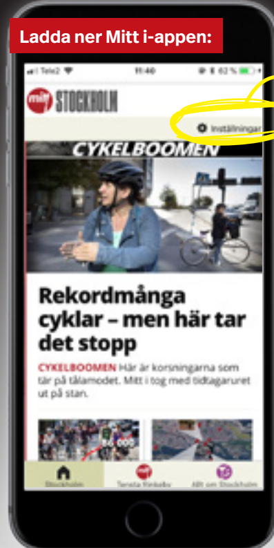
Ladda ner Mitt i-appen: