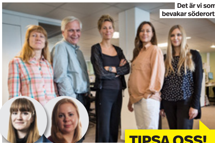
Det är vi som bevakar söderort!

Reporter Anna-Stina Ericson, anna-stina.ericson@mitti.se Reporter Marielle Theander Olsson, marielle.theanderolsson@mitti.se Nyhetschef Anna lms, tel 08-550 552 67 Fotograf Christian Lärk Mejla oss gärna enligt formen fornamn.efternamn@mitti.se Eller ring oss via växel: 08-550 550 00 Dagliga nyheter på: www.mitti.se/bandhagen Facebook: Sök på "Mitt i Söderort - Bandhagen" Twitter: @mittistockholm Instagram: @mittistockholm