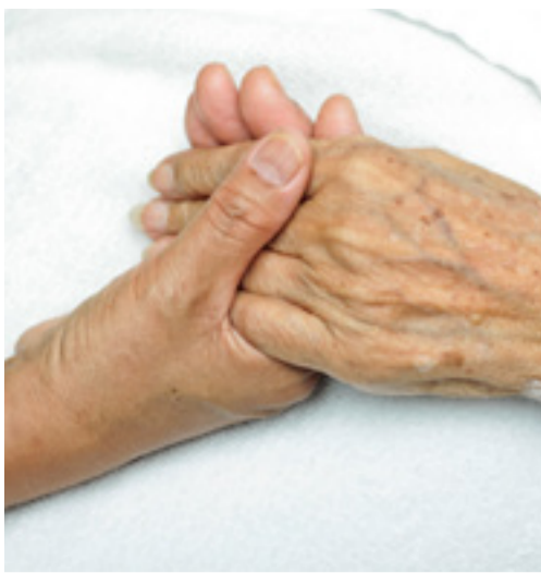
Ett hemtjänstföretag från Bandhagen har stoppats från att bedriva vård.