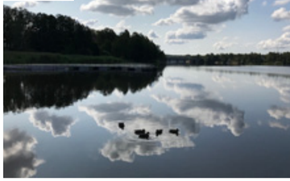
En rofylld bild från Långsjön.