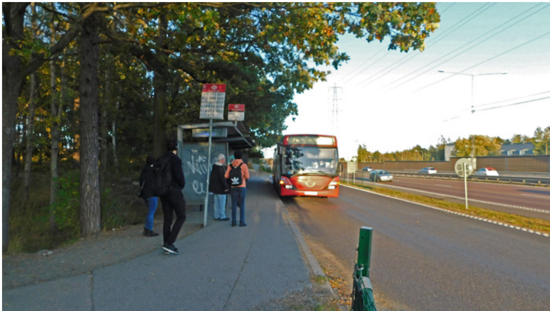
Här vid busshållplatsen Norra Sköndal intill Tyresövägen stod rånarna. De klev inte på bussen som Tainas son klev av, utan följde i stället efter honom.