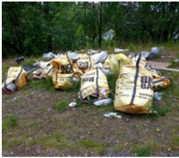
Vägräcken upprättas i Larsboda för att motverka olaglig dumpning.