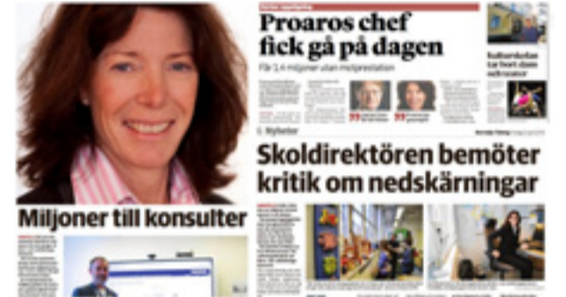
På tidigare jobb har Wetterstrand bland annat uppmärksamats för hårda nedskärningar och dyra konsulter.

ingrid.johansson@mitti.se tel 08-550 551 04