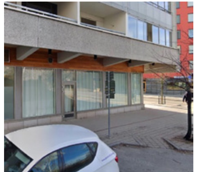
Vid tre tillfällen gick mannen till attack mot besökare till Sollentuna moské. Nu har han dömts för misshandel och olaga hot.

ingrid.johansson@mitti.se tel 08-550 551 04