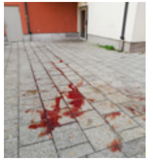
Syn som mötte barn på väg till skolan. Läsarbild