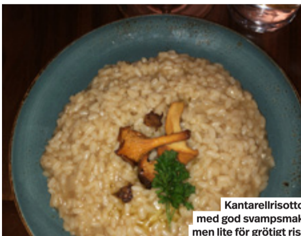
Kantarellrisotto med god svampsmak men lite för grötigt ris.