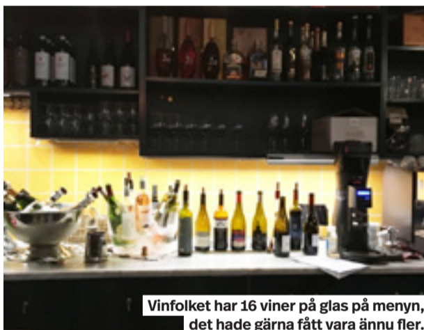
Vinfolket har 16 viner på glas på menyn, det hade gärna fått vara ännu fler.