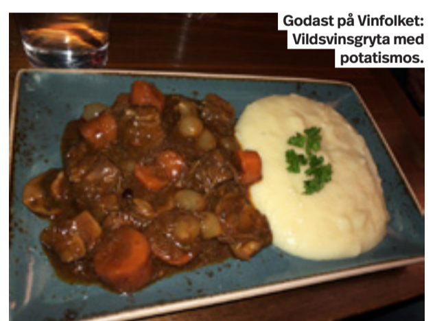
Godast på Vinfolket: Vildsvinsgryta med potatismos.