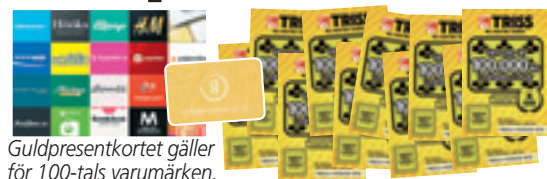
Guld-presentkortet gäller för 100-tals varumärken.

Rutorna med de röda siffrorna bildar en lösningskod som kan utläsas som ett fyrsiffrigt tal - t ex NIO ETT TJUGO (9120). Du kan ringa, swisha eller SMS:a in koden.