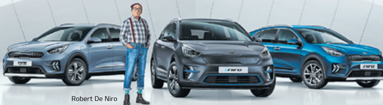
Robert De Niro

niro plug-in hybrid 1.6 GDI PLUG-IN HYBRID 141 HK DCT ADVANCE REK. CA PRIS FRÅN 339.900 KR