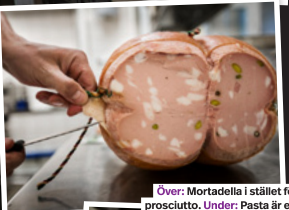
Över: Mortadella i stället för prosciutto. Under: Pasta är ett måste även om man satsar på en modern meny.