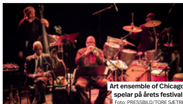
Art ensemble of Chicago spelar på årets festival.