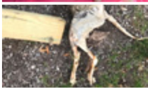
Polis ska nu undersöka den uppbrända katten.