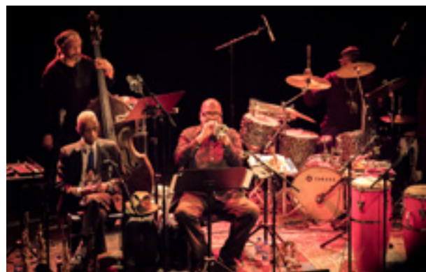
Art ensemble of Chicago är kända för sina performanceaktiga konserter, där de hade ansiktsmålningar och spelade på hundratals instrument.