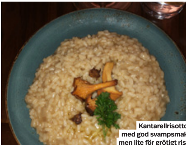
Kantarellrisotto med god svampsmak men lite för grötigt ris.