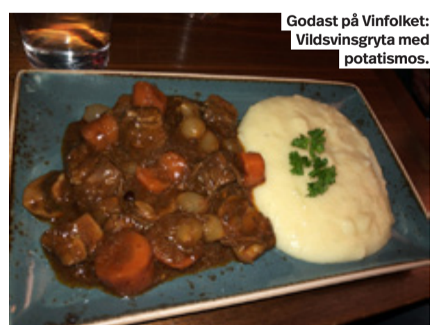
Godast på Vinfolket: Vildsvinsgryta med potatismos.