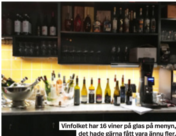
Vinfolket har 16 viner på glas på menyn, det hade gärna fått vara ännu fler.