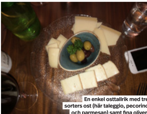
En enkel ostallrik med tre sorters ost (här taleggio, pecorino och parmesan) samt fina oliver.

Den som vill ha en bit mat till druvorna hittar halvportioner i en mycket kort meny. I ett huj har man ätit sig igenom allt, en del är riktigt bra, annat lämnar övrigt att önska.