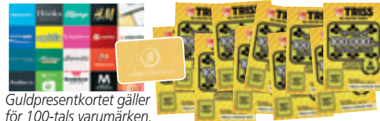
Guld-presentkortet gäller för 100-tals varumärken.

Rutorna med de röda siffrorna bildar en lösningskod som kan utläsas som ett fyrsiffrigt tal – t ex NIO ETT TJUGO (9120). Du kan ringa, swisha eller SMS:a in koden.