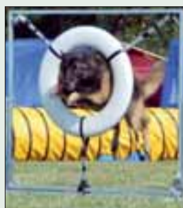
Vega hoppar däck.

● Sista måndagsdansen för så- songen till blandad musik, nytt