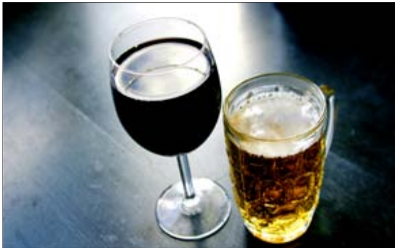
Böter skulle kunna utfärdas i stället för indraget tillstånd menar skribenten.

I regel har restauranger en bra översyn över vilka som vistas i lokalen då entrévärdar och ord-