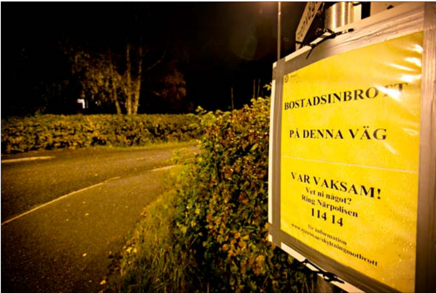
Tjuvarna väntar på mörkrets inbrott så att de kan arbeta osedda och ostört.