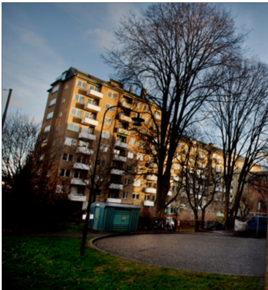
Längs Tessinparkens östra sida vittnar kvartersnamnen om tidiga arbetarrörelsen i Stockholm.

MEN SNART BLEV DEN i stället köks-trädgård och utflyktsmål för hovet och där statyn av Carl von Linné står i dag byggdes ett lusthus som kallades Rotundan och blev teater där det gjordes narr av de hög-stämnda föreställningar som gavs